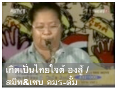
เกิดเป็นไทยใจดี อองลี่ / สมิท&เจน อมร-ดีม