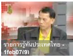
รายการรู้ทันประเทศไทย - 1feb07(9)