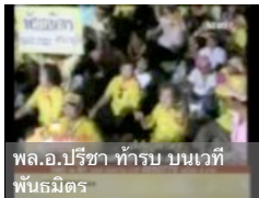
พล.อ.ปรีชา ท้ารบ บณเวที พันธมิตร