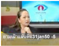
ยามเฝ้าแผ่นดิน31jan50 -5