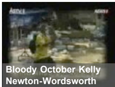
Bloody October Kelly Newton-Wordsworth

see all 1110 videos > I collect with vodpod