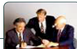
เตรียมตัวก่อนเรียนรู้ (Before learning)