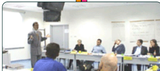
แนวคิดหลักของการเรียนรู้เครื่องมือ ทางการด้านการบริหารการพัฒนา (Management Tools Themes)