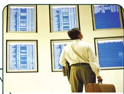
ระดับของการใช้งาน เครื่องมือ (Level)

วิเคราะห์ปัญหาขององค์กร (Root cause analysis) Fishbone diagram