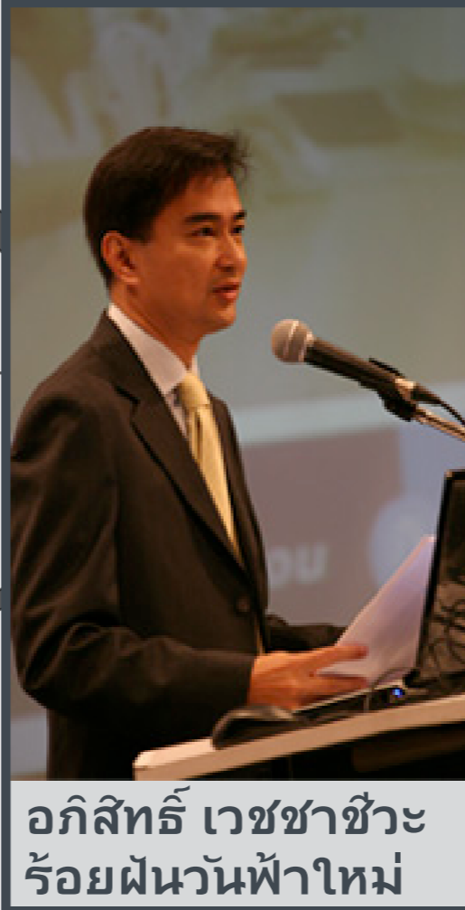
อภิสิทธิ์ เวชชาชีวะ ร้อยฝันวันฟ้าใหม่